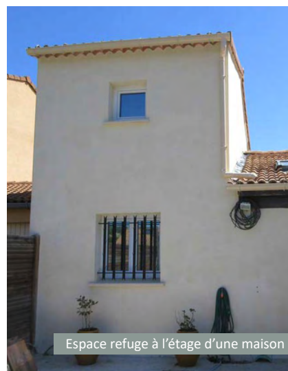
Espace refuge à l'étage d'une maison